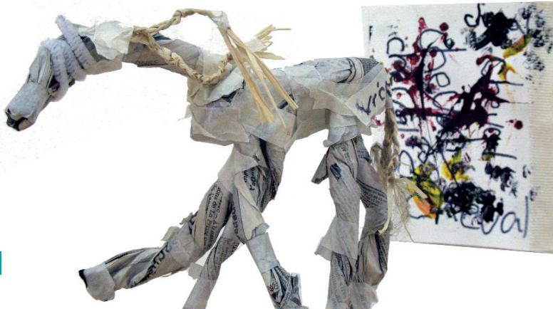
Vickie-Anne, 6 e année, des Trois-saisons

Tous nos ateliers et visites en galerie sont présentés en lien avec le Programme de formation de l'école québécoise, plus particulièrement les compétences en arts plastiques : apprécier des œuvres d'art, des objets culturels du patrimoine artistique, des images médiatiques, apprécier ses réalisations et celles de ses camarades et réaliser des créations plastiques personnelles.