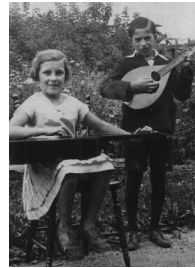
Fonds Rodolphe Léger, P28,D89,P1, [1935?] Centre d'archives de l'Outaouais de Bibliothèque et Archives nationales du Québec

Le Centre d'archives, de généalogie et d'histoire a comme mission l'acquisition, le traitement, la conservation et la diffusion du patrimoine archivistique et généalogique de l'Outaouais. Le Centre d'archives de l'Outaouais de Bibliothèque et Archives nationales du Québec, le Centre régional d'archives de l'Outaouais, la Section de la gestion des documents et des archives de la Ville de Gatineau et la Société de généalogie de l'Outaouais vous offrent une activité de découverte animée des archives et de généalogie.